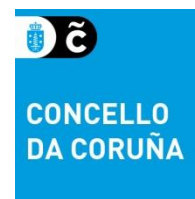
CONCELLO DA CORUÑA